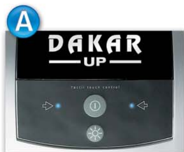
Sistema di taratura elettronica. Electronic adjustment system. Elektronische Einstellhilfe. Système de réglage électronique.