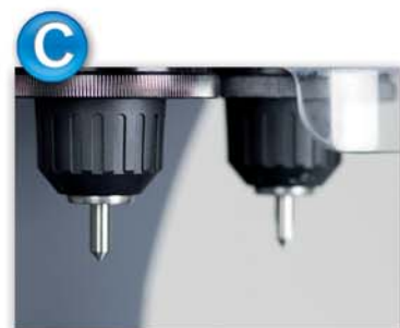
Possibilità di cambiare utensili in modo facile e veloce grazie ai mandrini autobloccanti. Self locking tool-holder with quick tool-change system. Selbst verriegelnder Werkzeughalter mit Schnellspannsystem für Fräser und Taster. Possibilité de changer les fraises très rapidement ed facilement par des mandrins auto-serrant.