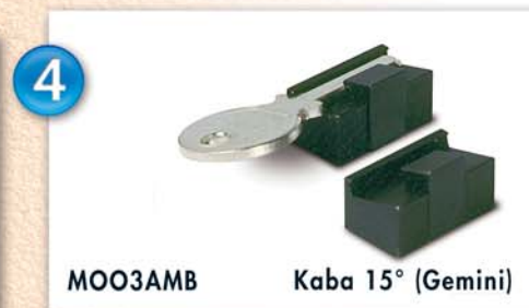
MOO3AMB Kaba 15° (Gemini)