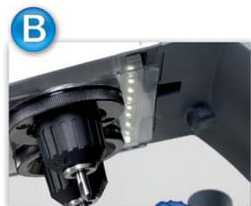
Illuminazione a led. Led lighting. Led Beleuchtung. Éclairage par led.