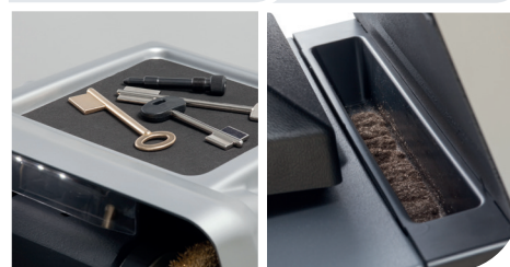
Swarf and accessories tray