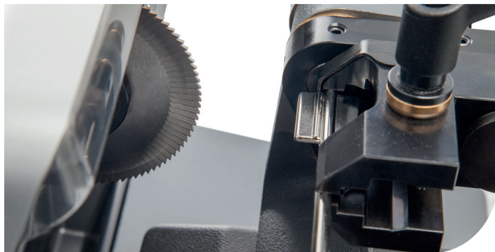
New clamp for "male" type keys